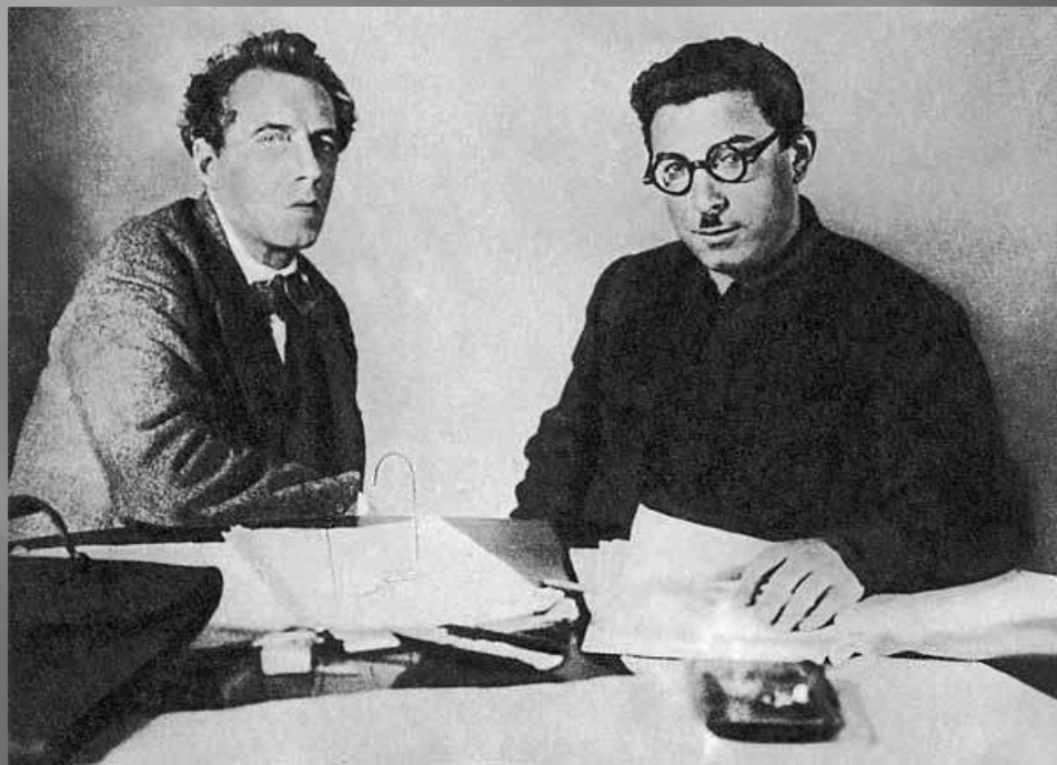
В.Э.Мейерхольд и И.Л.Сельвинский. 1929

Появление первой пьесы-трагедии И. Сельвинского «Командарм-2» (1928), поставленной Вс. Мейерхольдом в театре его имени в 1929 году, было значительным литературным событием тех лет. Пьеса прозвучала неожиданно свежо и сильно. В газете «Рабочая Москва» (20 октября 1929 г.) говорилось о «Командарме-2»: