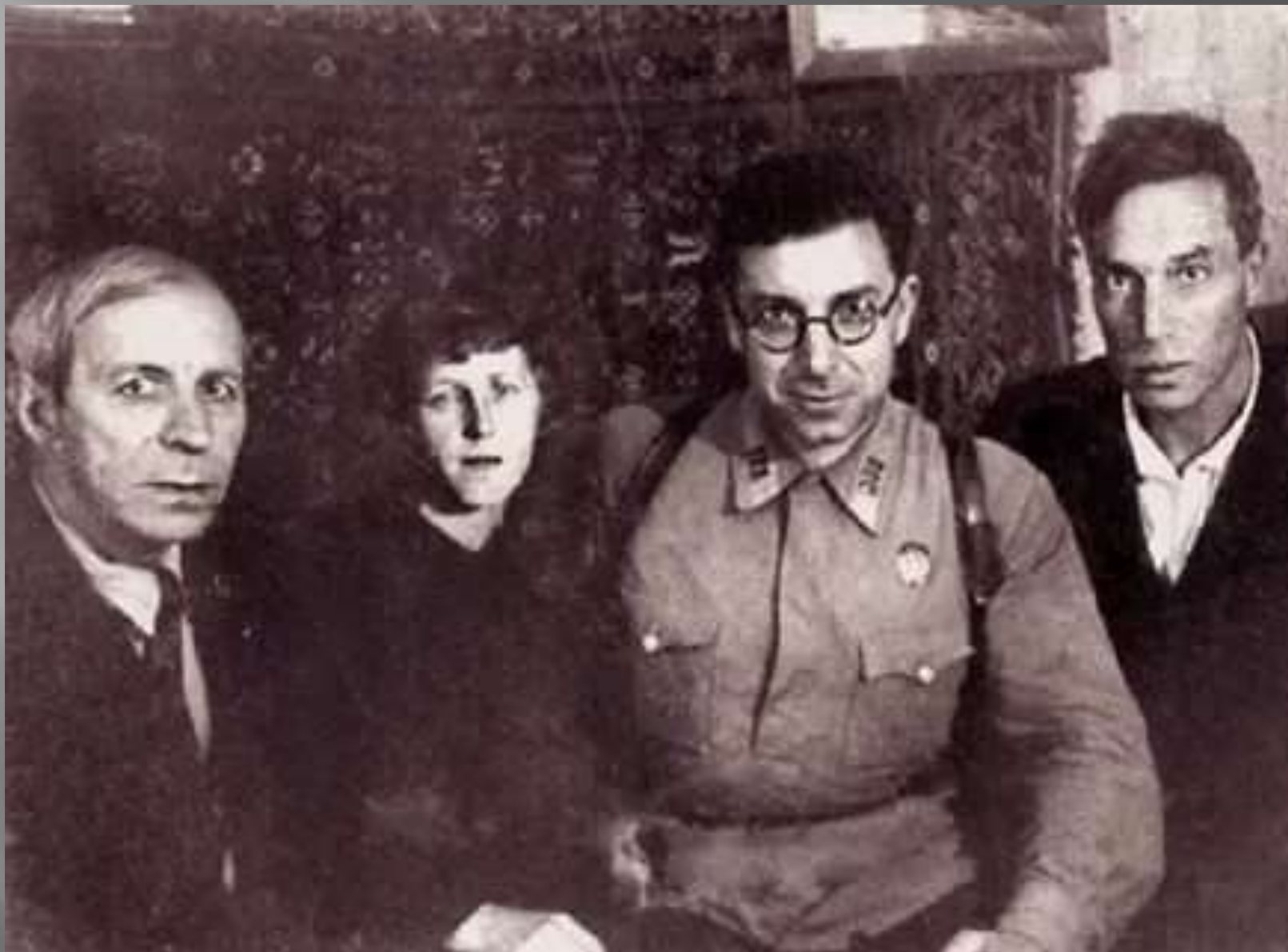
Николай Асеев, Мария Петровых, Илья Сельвинский, Борис Пастернак.